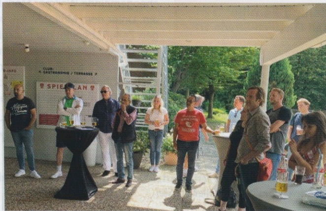
Den Mitgliedern des TC Südpark wurde Mitte Juni das neue Sponsoring- und Werbekonzept erläutert, das den Verein zukunftsfähig aufstellen soll.